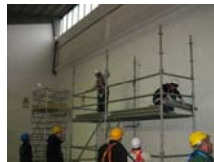
PROVE PRATICHE PONTEGGI