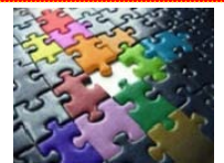
IL CATALOGO FORMATIVO