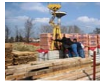
ATTIVITA' DI CANTIERE