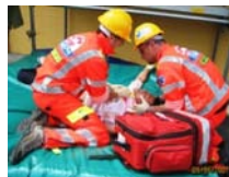
FORMAZIONE 1° SOCCORSO