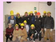
I RAGAZZI DELLA SCUOLA