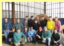
PARTECIPANTI AD UN CORSO

E LA SCUOLA EDILE CON IL CORSO TRIENNALE PER LA QUALIFICA DI OPERATORE EDILE